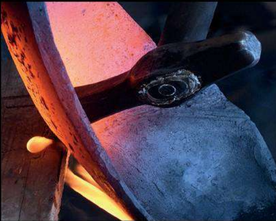
Conception : Marie d'Arbois et Sébastien Cassin